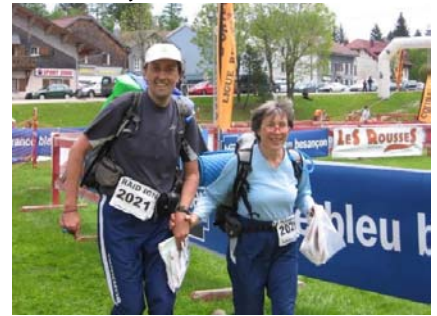
Les KLOUG'S ravis