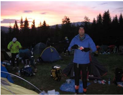
Vous êtes bien en montagne !