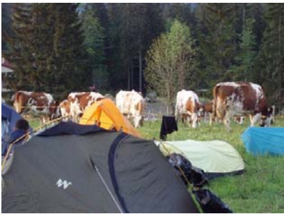
Vaches à comté