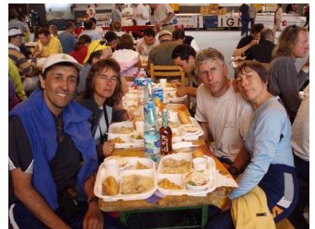
2 ème mouvement

Et la récup, je ne vous dit pas... 1 er mouvement