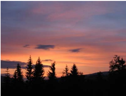
Paysage de la deuxième étape, juste avant une dernière montée de la mort !