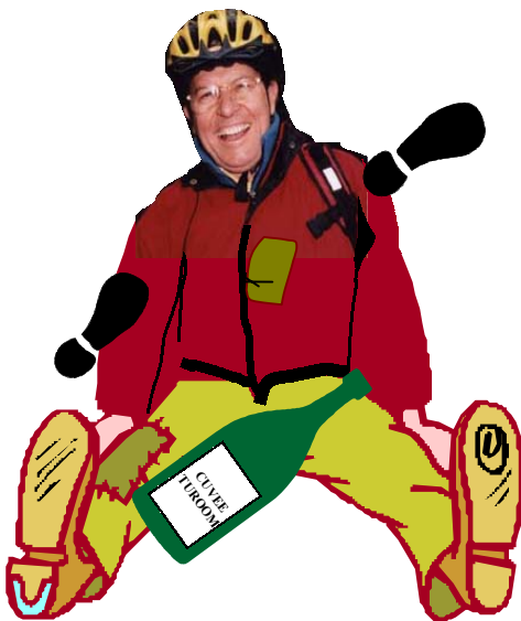
Image du G.O après une soirée à Vins sur Vins, association de bénévoles