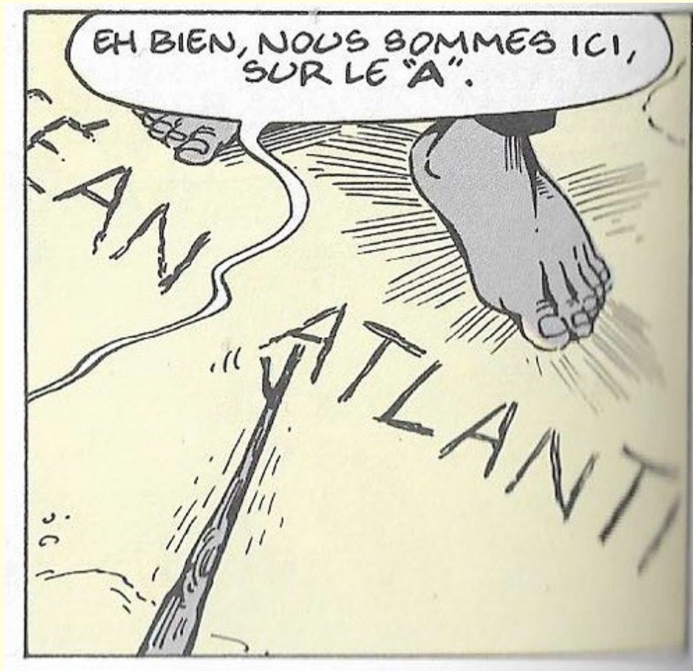
Philémon, le Naufragé du -A-, par Fred, éditions Dargaud

Ne cherchez pas sur le « e » de Pile ou le « d » de d'Angoulême : il ne correspondent à rien sur le terrain. Pour aller dans le Monde des Lettres, chacun sait qu'il faut emprunter un point de passage : un puits, une fermeture à glissière, de la bave d'escargot, les ronds de fumée de la pipe d'Oncle Félicien ou un coquillage gonflable par exemple !